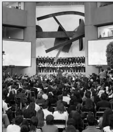
La comunidad universitaria cantando por primera vez el Himno de la Metro.

Al respecto, el autor de este Himno señaló que se trata de un poema que busca vincular las raíces más profundas de la institución con lo universal, presentando a la UAM de cara a México y a los retos del futuro, además de que con este canto se defiende la autonomía universitaria. "Eres semilla y futuro para un México diverso, raíz que desgrana el muro, casa abierta al universo", dice un fragmento.