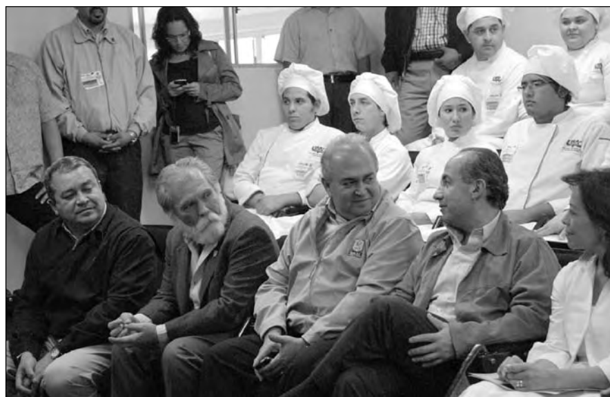
El presidente de la República Mexicana, el gobernador del estado y la secretaria de Educación Pública inauguraron las instalaciones académicas de la UABC.