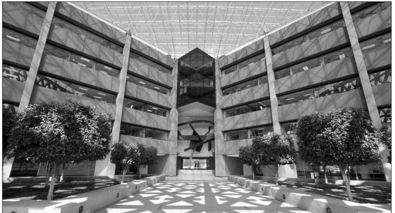
La Rectoría General de la UAM.

El editor es responsable de la orientación general del periódico y de los artículos sin firma y con seudónimo. Los artículos con firma son responsabilidad de sus autores.