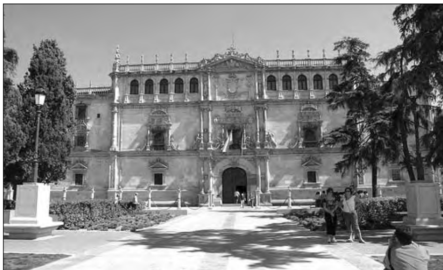
Fachada principal de la Universidad de Alcalá de Henares.

El programa se articula en la oferta de los siguientes servicios