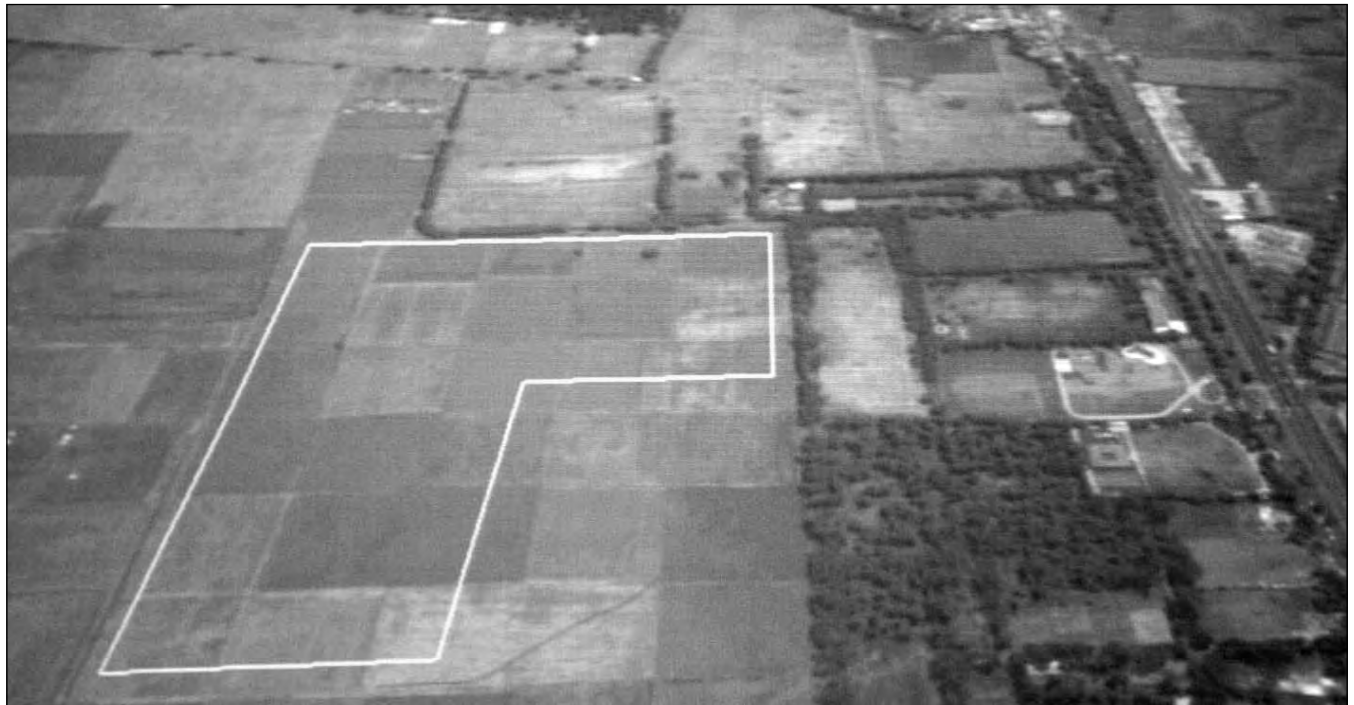
Vista aérea de la ubicación de lo que será la quinta Unidad de la Universidad Autónoma Metropolitana.

Me es claro que tenemos una opción interesante pues representa el crecimiento de la universidad pública y hay un apoyo obvio que incluye además 220 nuevas plazas académicas para la UAM, es un reto importante que puede ser benéfico: convertirnos en una universidad que resuelve los problemas que enfrenta el país, una UAM más sólida, con presencia en lugares distintos, consideró.